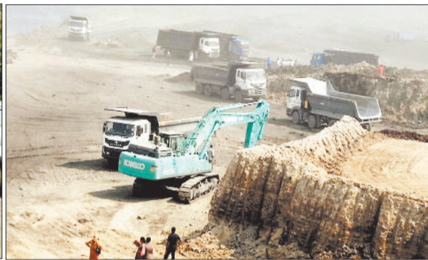
खदान में पसरा सन्नाटा।