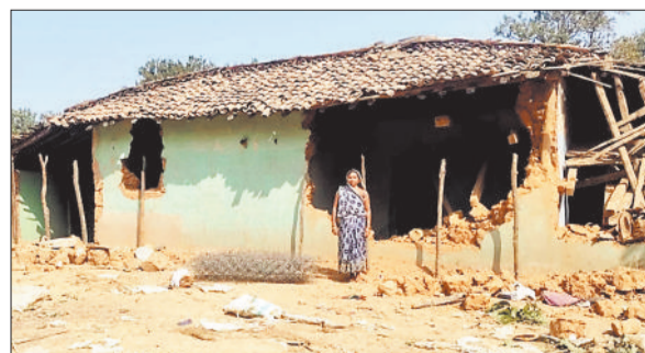
हाथी हमले से क्षतिग्रस्त मकान।

खासा आक्रोश है। वहीं वन विभाग की टीम ने हाथी प्रभावित ग्रामीणों को आंगनबाड़ी में शिफ्ट कर दिया है। वन विभाग हाथियों की निगरानी