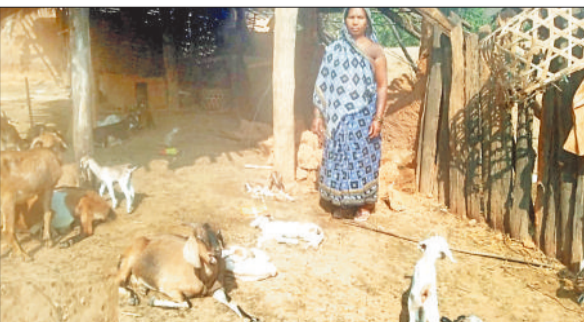
हाथियों के हमले से मृत मवेशी।

कटघोरा वन मंडल में विचरण कर रहा 48 हाथियों के झुंड ने बुधवार की रात जमकर उत्पात मचाते गांव में घुसकर जमकर तबाही मचायी है। जहां चार ग्रामीणों के मकानों को पूरी तरह ध्वस्त कर दिया है, तो वहीं दूसरी ओर उनके मवेशी व जानवरों पर भी हाथियों का कहर बनकर टूटा है। बताया जाता है कि हाथियों ने कई मवेशियों को भी मौत के घाट उतार दिया है। वहीं किसानों के घर में रखे व पीडीएस के चावल को भी हाथियों ने चट कर दिया है। हाथियों के उत्पात की वजह से लोगों में