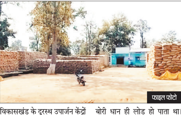
फाइल फोटो विकासखंड के दूरस्थ उपार्जन केंद्रों से धान का उठाव नहीं हो सका। खानापूर्ति के लिए राइस मिलर्स दूर के उपार्जन केंद्रों में 1-2 ट्रक भेज दिया करते थे। जिसमें 6 से 7 सौ बोरी धान ही लोड हो पाता था। उठाव के लिए मिलर्स के द्वारा दूरस्थ उपार्जन केंद्रों के लिए रिक्वेस्ट नहीं डाले जाने के कारण धान का उठाव रफ्तार नहीं पकड़ सका है।

अपेक्षाकृत कम होने के कारण समितियों से धान नहीं उठा पा रहा है। जनवरी में 20 दिन तक मार्केट के द्वारा धान उठाव पर रोक लगाए जाने के कारण जिले के सभी 65 उपार्जन केंद्रों में लाखों क्विंटल धान जाम हो गया था। 3 फरवरी से जब धान उठाव की अनुमति दी गई तब राइस मिलर्स के द्वारा पूर्व में काटे गए डीओ को लेकर समितियों से धान उठाव का काम करते रहे और इसलिए राइस मिलर्स आसपास की समितियों से सबसे पहले धान उठाव का काम शुरू किया। फलस्वरूप पोड़ी उपरोड़ा और कोरबा