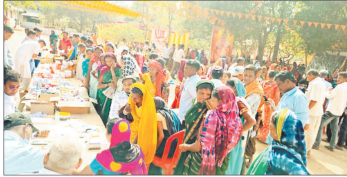
स्वास्थ्य शिविर में उपचार कराते ग्रामीण।