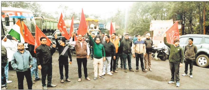
खदानों के बाहर प्रदर्शन करते ट्रेड यूनियन के नेता।